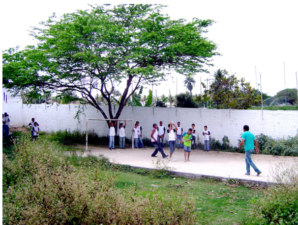
Imagem 03: Quadra de futebol

estes espaços, culturalmente são dados para que as pessoas apresentem comportamentos de acordo com movimentos produtivos, dependendo da condição física, mental e social, para que possam aprender e raciocinar o espaço, relacionar-se e se movimentar, para uma linha de produção dentro de um sistema.